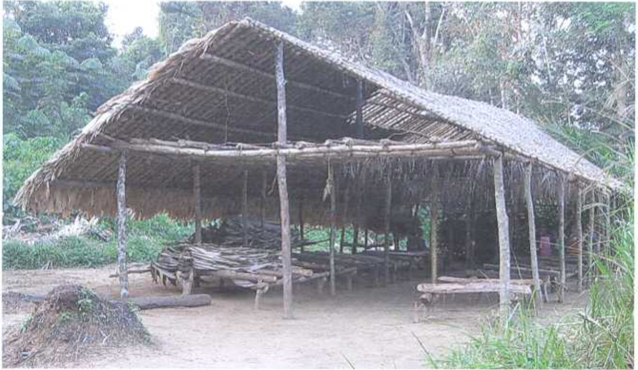
Eine ganz normale Buschkirche

Am Morgen wecken mich die Hähne und Kinderstimmen auf. Heute scheint die Sonne – ein gutes Vorzeichen. Die Heilige Messe ist gut besucht, auch die beiden behinderten Frauen sind gekommen, die von mir ein Dreirad bekommen haben. Es ist bereits 12 Uhr als der feierliche Gottesdienst zu Ende geht.